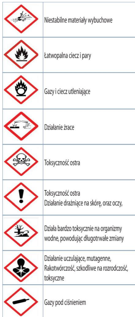
Tabela 1. Klasyfikacja i oznakowania niebezpiecznych substancji chemicznych