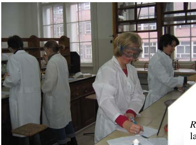
Rys. Studenci podczas wykonywania ćwiczeń laboratoryjnych z Chemii Nieorganicznej

Przed każdym doświadczeniem należy zastanowić się, jakie reakcje i okoliczności związane z ich przebiegiem mogą stanowić ewentualne zagrożenie i podjąć właściwe środki zaradcze. W przypadkach wątpliwych należy zwrócić się o poradę.